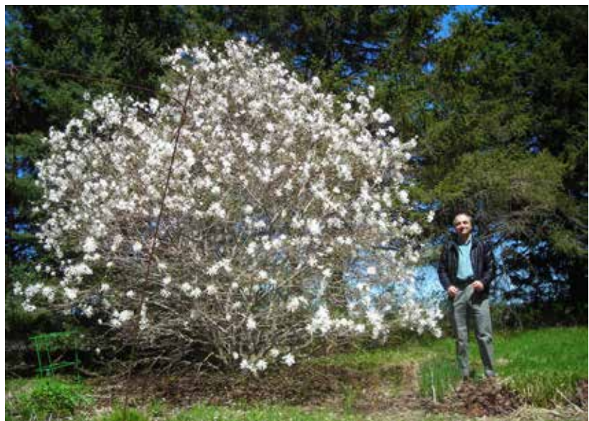
3. Alain est particulièrement fier de la floraison de ses magnolias

J e suis fier des plants et des aménagements qui réussissent bien. Avec le temps et les essais qui réussissent, de plus en plus d'éléments deviennent des sources de fierté. Une talle de cypripède, de sanguinaire double, un magnolia, un maakia en fleur, un pommier, un poirier ou un prunier plein de fruits délicieux, mon jardin de Rhododendrons ou mon jardin sous le soleil en fleurs, en sont des exemples. (photo 3)