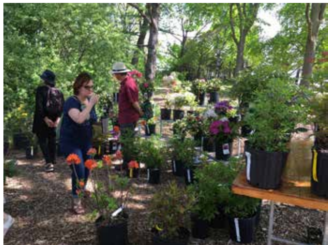
2. Des amateurs de rhododendrons au kiosque de la SRQ

Merci également à tous les membres, anciens et nouveaux, d'être passés nous saluer au kiosque. Ce fut un plaisir de vous servir.