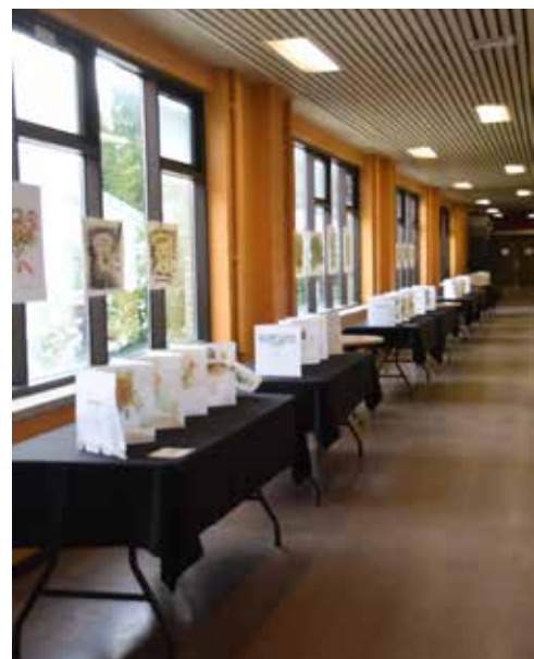
3. Allée de l'exposition