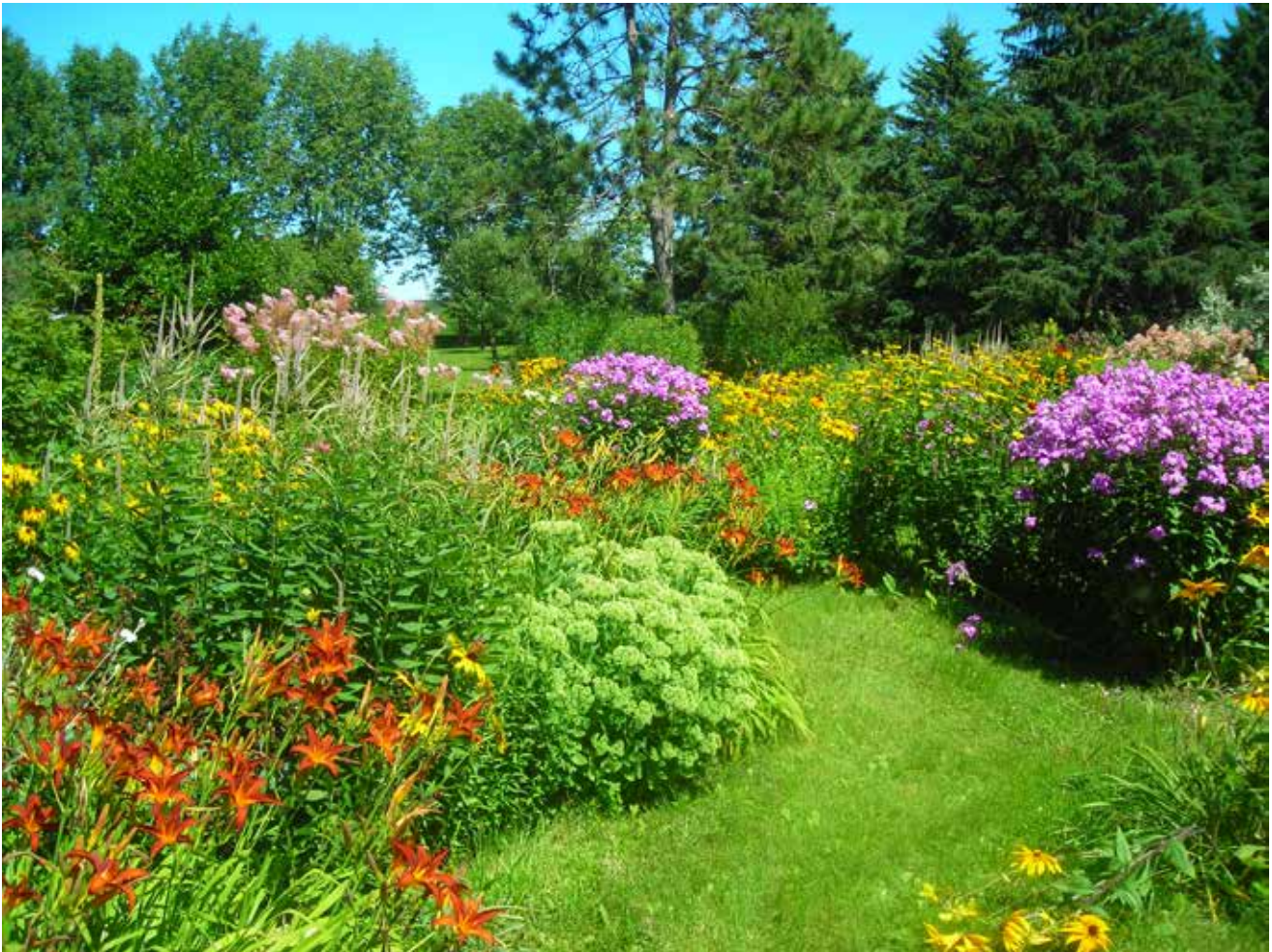
1. Vue du labyrinthe de plates-bandes de vivaces au soleil

L e Jardin au soleil est un grand espace ouvert destiné à recevoir des plates-bandes de vivaces. Comme j'aime avoir accès à toutes les plantes, j'y ai implanté un labyrinthe de plates-bandes étroites qui se croisent et se succèdent. C'est un jardin spectaculaire de la mi-juillet à la fin de l'été où les campanules, rudbeckies, phlox, héliénies et hémérocailles colorent ce jardin. (photo 1)