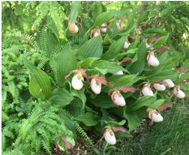
2. Les cypripèdes en fleur ravissent les visiteurs.

Tu cultives également des plantes et des arbres rares comme la plante indigène sanguinaire du Canada ( Sanguinaria canadensis ) protégée par la loi depuis 2005, des sabots de la vierge ( Cypripedium ) inusités un Magnolia blanc dont tu es très fier.